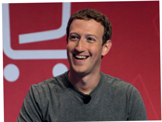
■ Mark Zuckerberg

Zuckerberg ha repetido, por tercer año consecutivo, el mismo mensaje en el MWC: “Creemos que todo el mundo debería tener acceso a internet. Es una locura que en 2016 estemos aquí sentados y aún haya 4.000 millones de personas que no puedan acceder a la red, algo que ninguna empresa ni gobierno pueden solucionar por sí solos.”